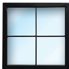
Hublot Noir Raam zwart