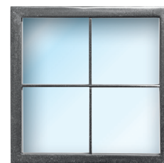
Hublot Old Silver Raam old silver