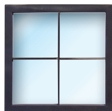
Hublot Carbon Black Look Raam carbon zwart