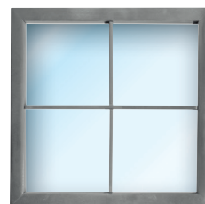
Hublot Inox Plus Raam inox plus