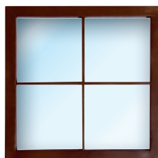
Hublot Rouille Raam rouille